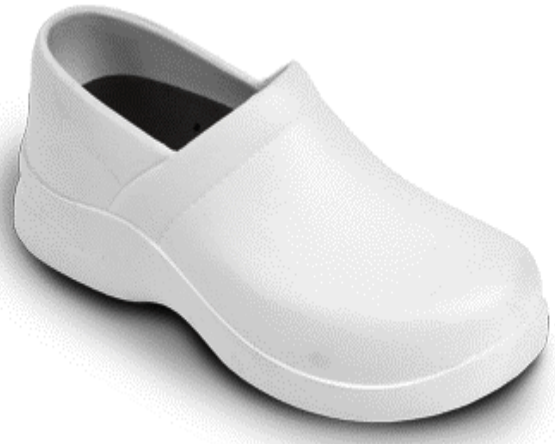
Figure 1 General shoes