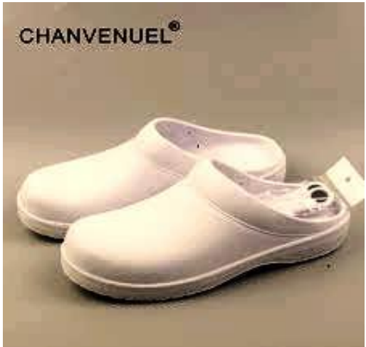
Figure 2 OR shoe